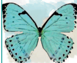
MARIPOSA BANDERA ARGENTINA